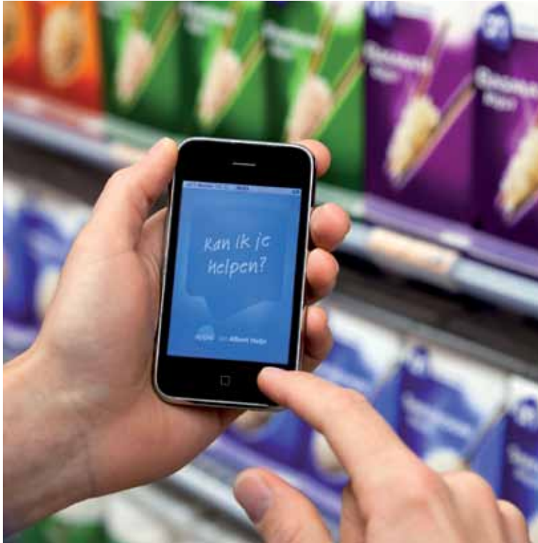
Appie werd in het grootste geheim ontwikkeld door IceMobile.

Met de introductie van Appie zet Albert Heijn als eerste Nederlandse supermarkt de stap naar een 'shop-assistent'. Met Appie kunnen klanten boodschappenlijstjes maken op basis van onder meer eerdere aankopen, bonusaanbiedingen en recepten. Verder kent Appie tal van andere mogelijkheden, zoals een 'wegwijzer' naar Albert Heijn.