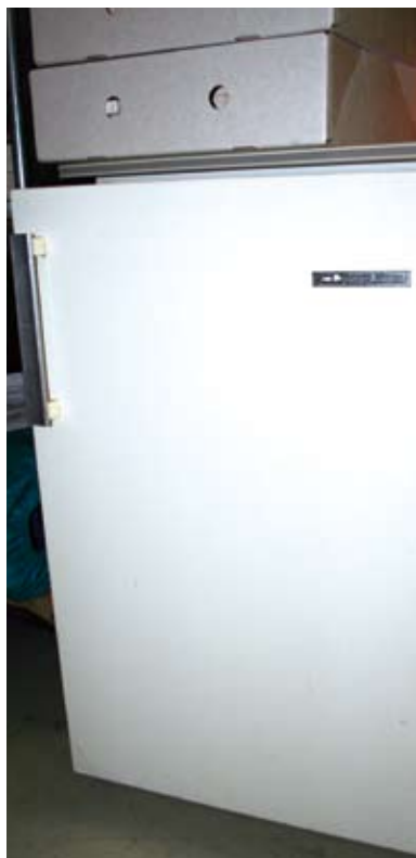
Albert Heijn heeft Nederland aan de koelkast gebracht. Dankzij de Premie van de Maand Club (PMC) die in 1962 werd gelanceerd vonden 145.000 koelkasten hun weg naar de Nederlandse huishoudens.

Enkele jaren geleden verkaste het Albert Heijn Erfgoed van een ruimte van 100 m 2 in het Albert Heijn-hoofdkantoor naar een geconditioneerd vertrek van 300 m 2 in de Albert Heijn Coffee Company. Een noodzakelijke verhuizing aangezien de relikwieën het raam uitpuilden. Hoewel de verzameling het daglicht zeker verdient te zien, zijn er nog geen plannen om de materialen voor het grote publiek toegankelijk te maken. Supermarkt Actueel brengt enkele bijzondere eigendommen van het Erfgoed in beeld.