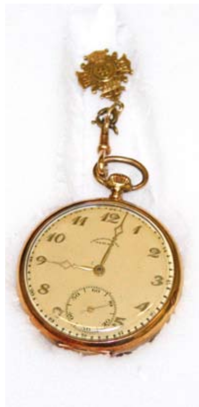
Het authentiek horloge van oprichter Albert Heijn maakt ook deel uit van de collectie van het erfgoed. Het dateert van rond 1900.