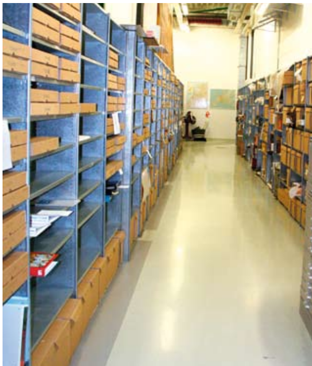
Alle historische eigendommen worden geconditioneerd bewaard bij Albert Heijn Coffee Company. Op de foto is de helft van de collectie te zien.